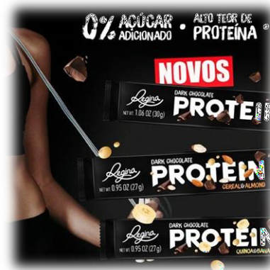
蛋白零食和巧克力