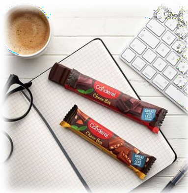
无糖零食和巧克力